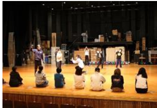
ピッコロ演劇学校