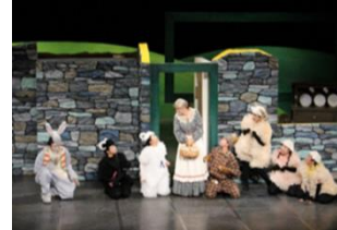
ピッコロ劇団ファミリー劇場